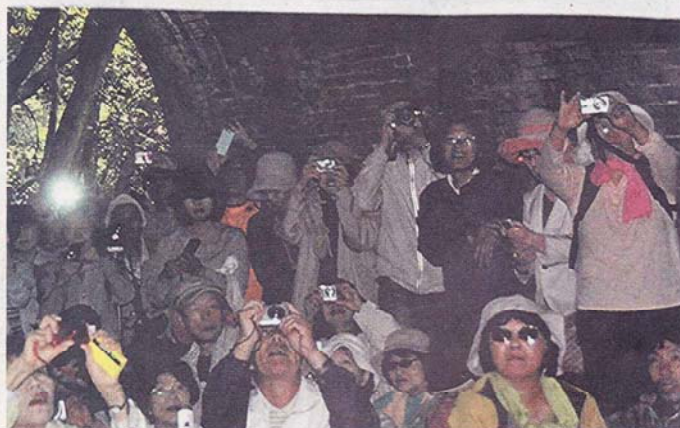
①スクリーンに映し出された太陽のリングにカメラを向ける来場者ら ②70センチ離れたトンネル内のスクリーンへ太陽光を投影し、刻々と日食の様子を伝えた手作りの自動追尾装置=いずれも春日井市の愛岐トンネル群で